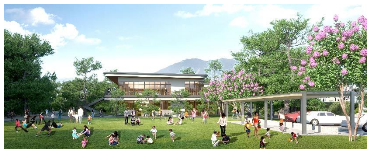
再整備後イメージ