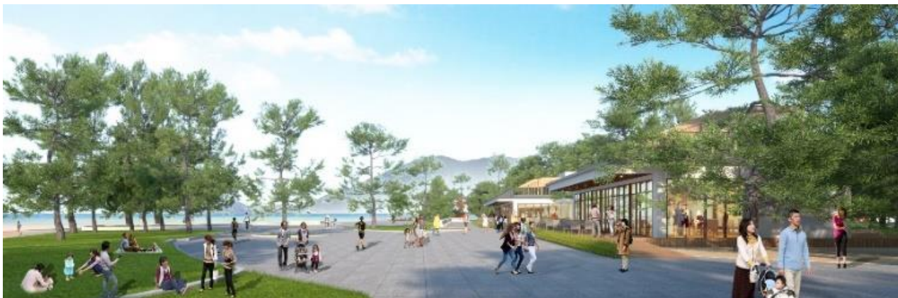
にぎわい施設イメージ